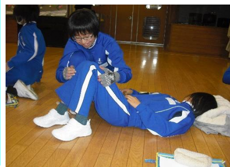
介助を模擬体験する6年生