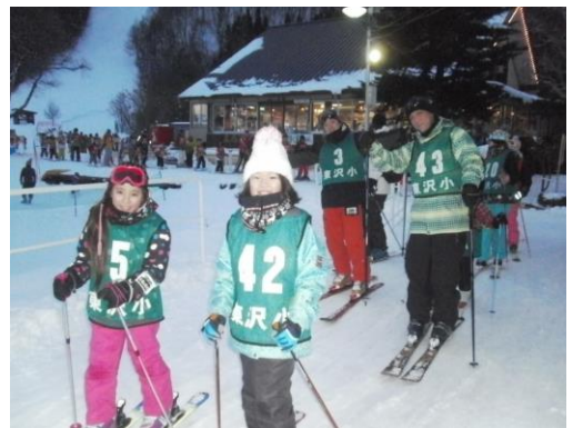
「PTA親子でスキーを楽しむ会」