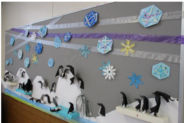
「ペンギンさんたちも元気です！」 ——こまくさ掲示板より——