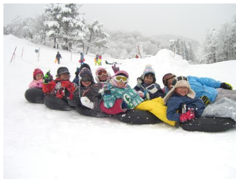
「雪ん子教室」チューブすべり