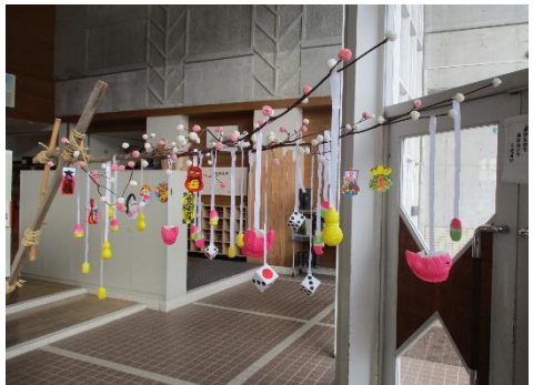
学童さんからいただいた「だんご木」です