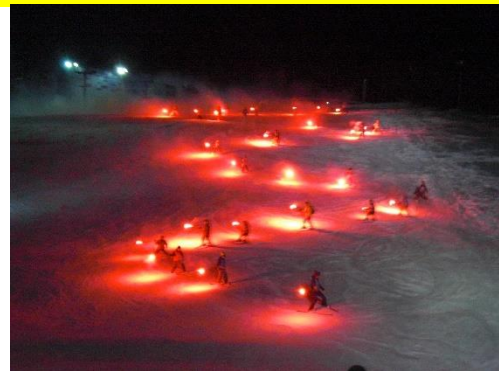
幻想的な「たいまつ滑走」